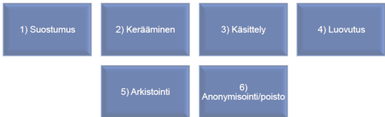
Kuva: Henkilötietojen elinkaari

Tietosuoja-asetuksen vaatimusten toteutuminen tulee taata määrittelyvaiheesta koko käsiteltävien henkilötietojen elinkaaren ajan. Elinkaarella tarkoitetaan ajanjaksoa henkilötietojen keräämisestä niiden anonymisointiin tai poistoon, ks.kuva.