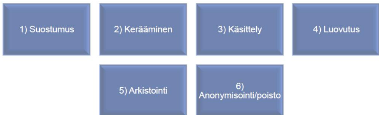
Kuva: Henkilötietojen elinkaari

Tietosuoja-asetuksen vaatimusten toteutuminen tulee taata määrittelyvaiheesta koko käsiteltävien henkilötietojen elinkaaren ajan. Elinkaarella tarkoitetaan ajanjaksoa henkilötietojen keräämisestä niiden anonymisointiin tai poistoon, ks.kuva.